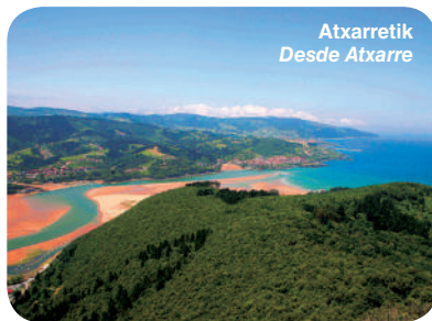
Atxarretik Desde Atxarre