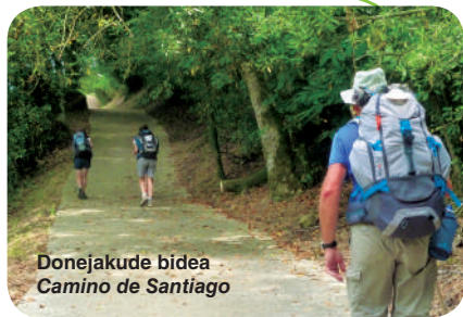
Donejakude bidea Camino de Santiago

Oso gutxitan biltzen dira espazio txiki batean horrenbeste elementu hain erakargarri, paisaia bitxia betetzen dutenak eta ingurune honen iraganera hurbiltzen gaituztenak. Bertan, Golako erreka, ibaiertzeko basoa eta Urdaibaiko Biosfera Erreserbako harizti zabalea nabarmentzen dira. Golako ibilbideak balio kultural handiko baliabide ugari biltzen ditu bere baitan, besteak beste, Zarratik Elexalderako galtzada, Artzubiko zubia, Montolaneko dorretxea, San Pedro basiliza, San Tomas eliza eta Olazarra burdinola.