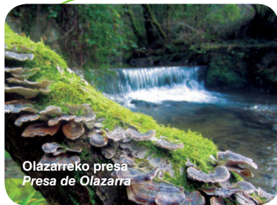
Olazarreko presa Presa de Olazarra