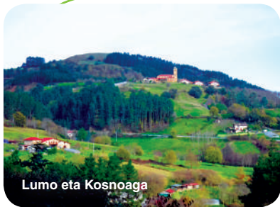
Lumo eta Kosnoaga