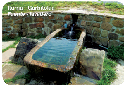
Iturria - Garbitokia Fuente - lavadero

Gernikako hiribildutik Lumoko elizateraino, gure herri ospetsuaren historian zehar egindako bidaia. Hiribildutik abiatuta, elizateraino igoko gara, galtzada zaharretik, eta Kosnoagarantz joango gara. Garai batean Burdin Aroko kastroa izan zen haren gailurra. Merezi du posizio nagusi horrek eskaintzen dituen ikuspegiez gozatzea, Baldatika errekaaren arroan dagoen Goikoerrotta errotara jaitsi aurretik. Aurrera egingo dugu Arnotxerri auzorantz, non San Kristobal basiliza eta Urdaibai dorrea ageri diren, eta ondoren Forurantz jarraituko dugu. Foruko herrixka erromatarretik igaro ondoren, ibilbidea goiko estuarioko pasabideetara jaisten da, eta han Oka ibaiaren ertzetan hazten diren ihitokiak gurutzatuko ditugu.