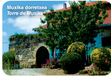
Muxika dorretxea Torre de Muxika

Muxika Urdaibaiko udalerriz zabal eta ezezagunenetako bat da. Sosegua lagun, xarma handia du ingurune horrek.