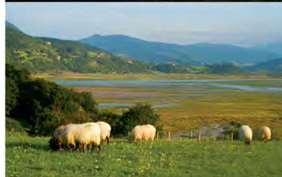
Campiña y marismas de Busturia