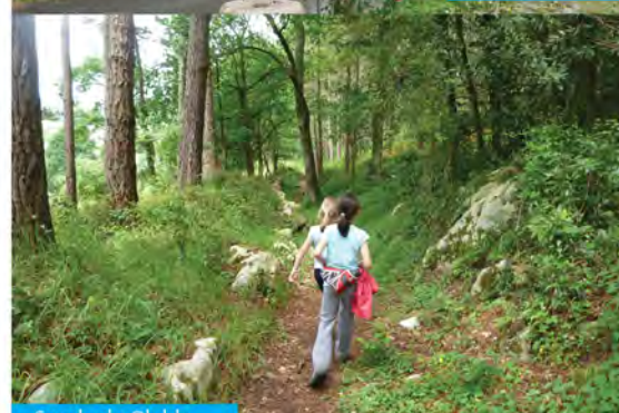
Senda de Olalde