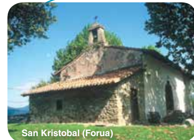
San Kristobal (Forua)