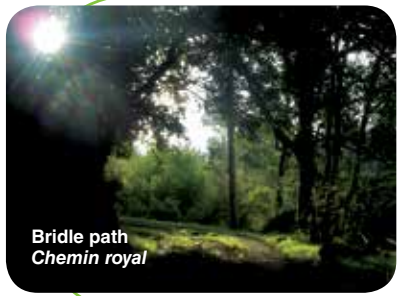
Bridle path Chemin royal