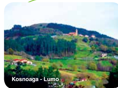
Kosnoaga - Lumo